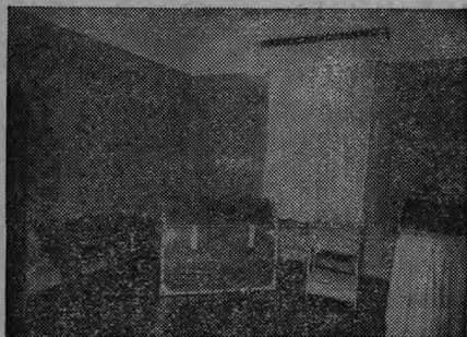
BAÚ DO CEGO (Secção de Costura)