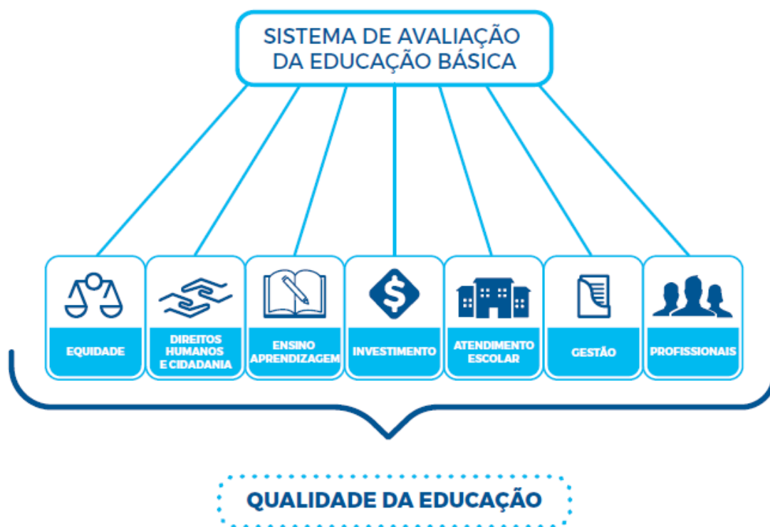
FIGURA 2 Os Eixos da qualidade da Educação Básica

A partir das discussões havidas e dos estudos produzidos, em síntese, propõe-se um sistema de avaliação que tenha como objetivo medir a qualidade da educação a partir de sete Eixos: Equidade, Direitos Humanos e Cidadania, Ensino-Aprendizagem, Investimento, Atendimento Escolar, Gestão e Profissionais Docentes. Além de seu detalhamento no Quadro II, este arranjo é apresentado sinteticamente por meio da Figura 2.