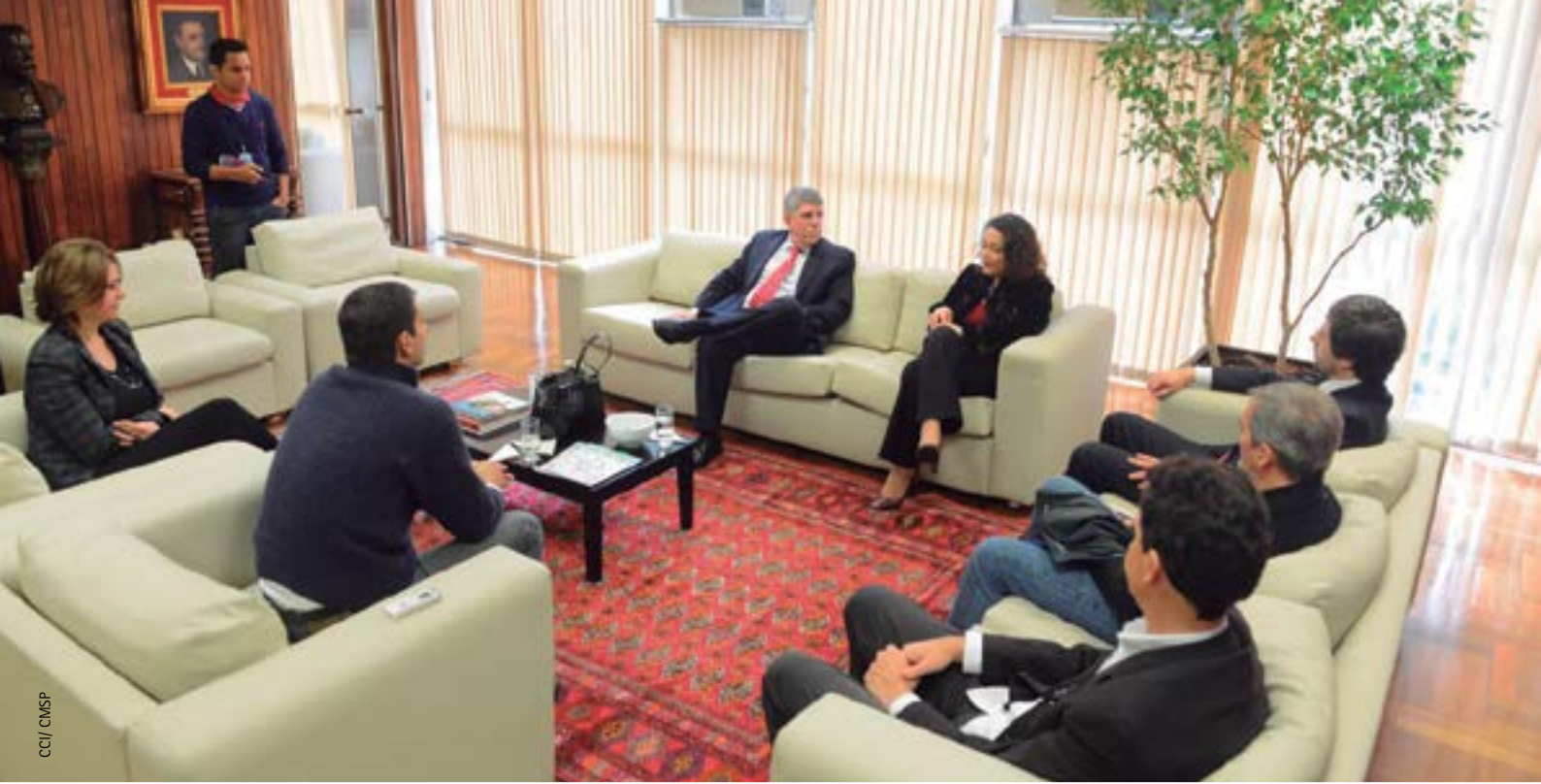
Acordo de cooperação firmado com a Universidade Federal de São Paulo (UNIFESP)

14 maio de 2016, teve como primeira atividade um curso na modalidade EAD de formação em Direitos Humanos (2016). A proposta do curso, com 90 horas-aula, é ofertar ações de formação que provoquem, motivem e subsidiem a efetivação de práticas, atitudes e processos geradores de uma cultura pautada pelos fundamentos e conquistas dos direitos humanos. A primeira turma do curso foi composta por 150 alunos, tendo 50 vagas reservadas para os alunos e servidores da UNIFESP, 80 vagas destinadas aos servidores públicos da Prefeitura do Município de São Paulo e da Câmara Municipal de São Paulo e 20 abertas ao público em geral.