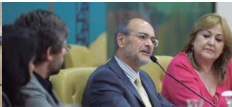
Formatura em 2015 do curso de pós-graduação Legislativo e Democracia no Brasil