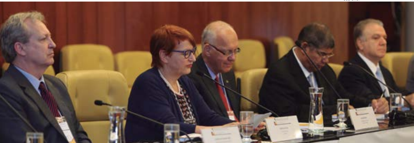
5th German-Brazilian Dialogue on Science and Innovation 2016 – The City of Tomorrow – Tackling Urban Challenges and Opportunities | 5º Diálogo Brasil-Alemanha sobre ciência e inovação – A cidade do amanhã – Desafios e Oportunidades dos Conglomerados Urbanos

– realizado em parceria com o Centro Alemão de Ciência e Inovação São Paulo (DWIH-SP) e a Fundação de Amparo à Pesquisa do Estado de São Paulo (FAPESP)