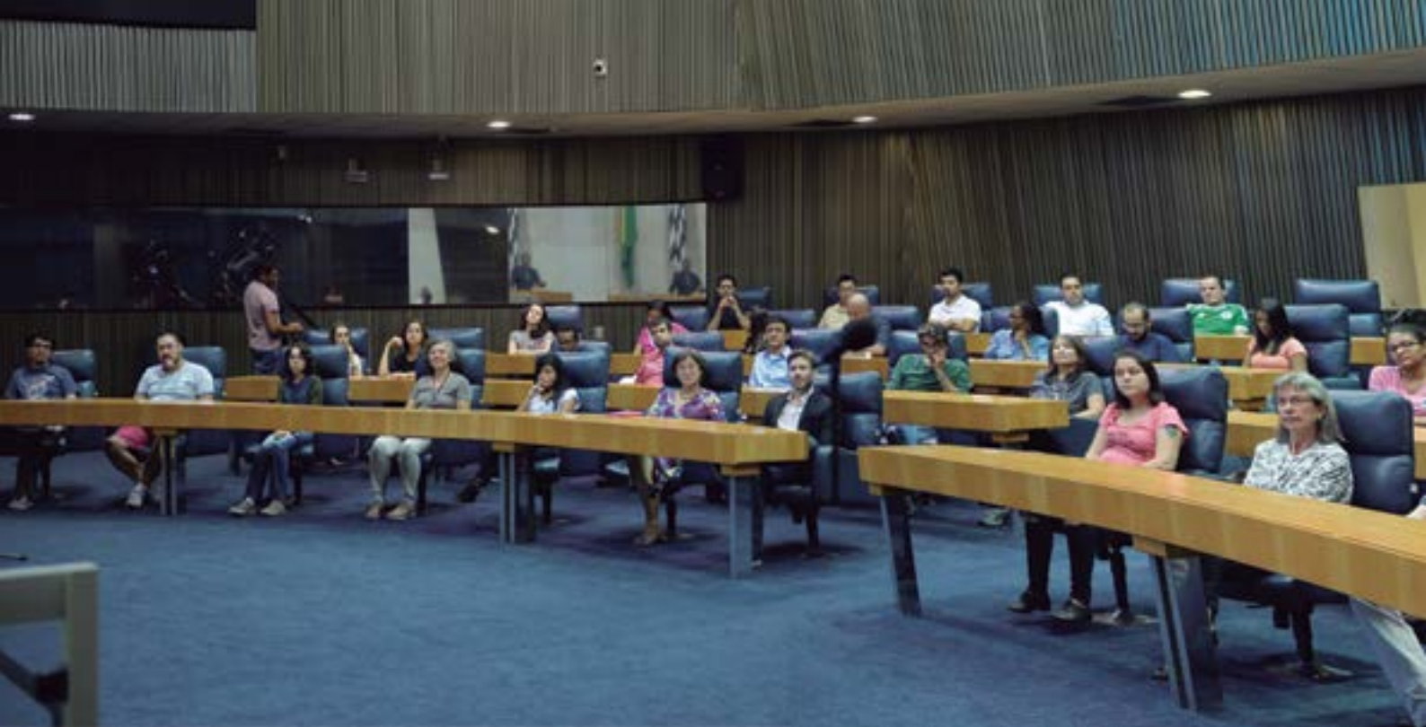
Memória Institucional e Legislativo: recursos e possibilidades

38 Ensino (DRE) do Ipiranga, Santo Amaro, Itaquera e Penha, com o objetivo de compreender a importância do espaço escolar como local de formação do cidadão participativo e a relevância do papel dos educadores na promoção do exercício democrático de participação.