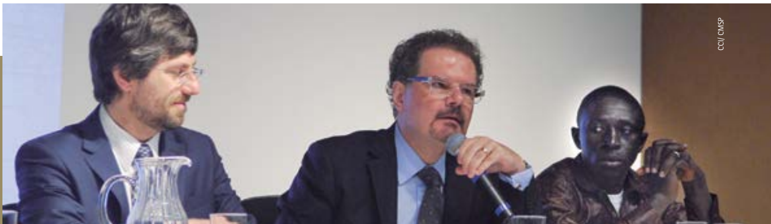
Seminário São Paulo de todos os Imigrantes – organizado pela Escola do Parlamento, pelo Museu da Imigração do Estado de São Paulo e pela Defensoria Pública

cujo objetivo é abordar temas transversais às migrações contemporâneas, discutir mecanismos que visam garantir o acesso pleno de direitos aos migrantes e debater fronteiras legais tendo como foco principal a integração social e cultural proporcionada pelo intercâmbio de experiências e vivências das diferentes comunidades no espaço público.