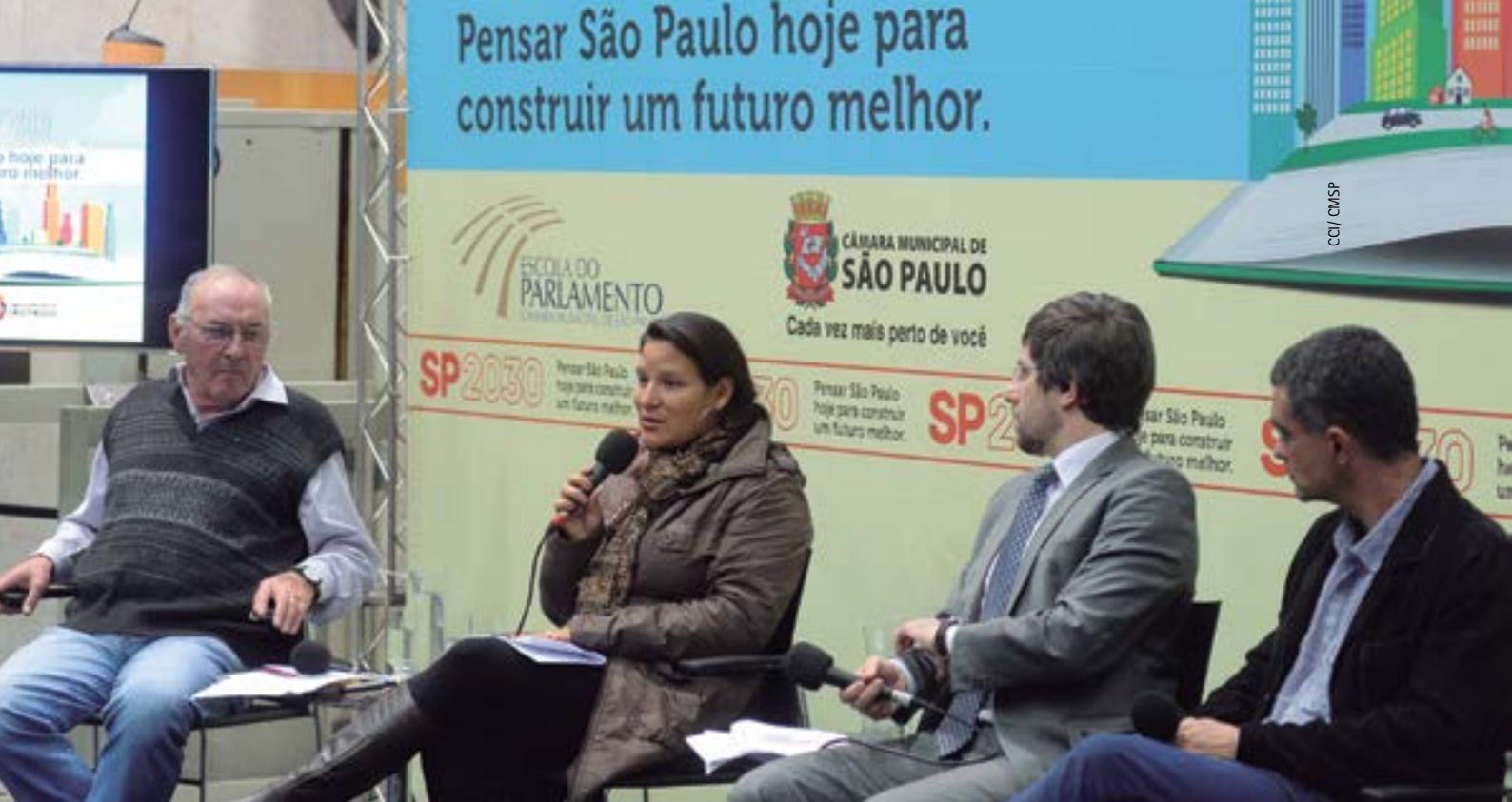
O Ciclo de debates São Paulo 2030 foi uma das atividades do Eixo Temático Estudos da Metrópole.

30 do Democrático de Direito e de respeito, além do empoderamento de minorias sociais foram destaque também nos seminários Ditadura e Direitos Humanos (2015), Desigualdade Racial no Brasil: Desafios e Perspectivas (2015) e no ciclo de debates sobre Igualdade de Gênero (2016).