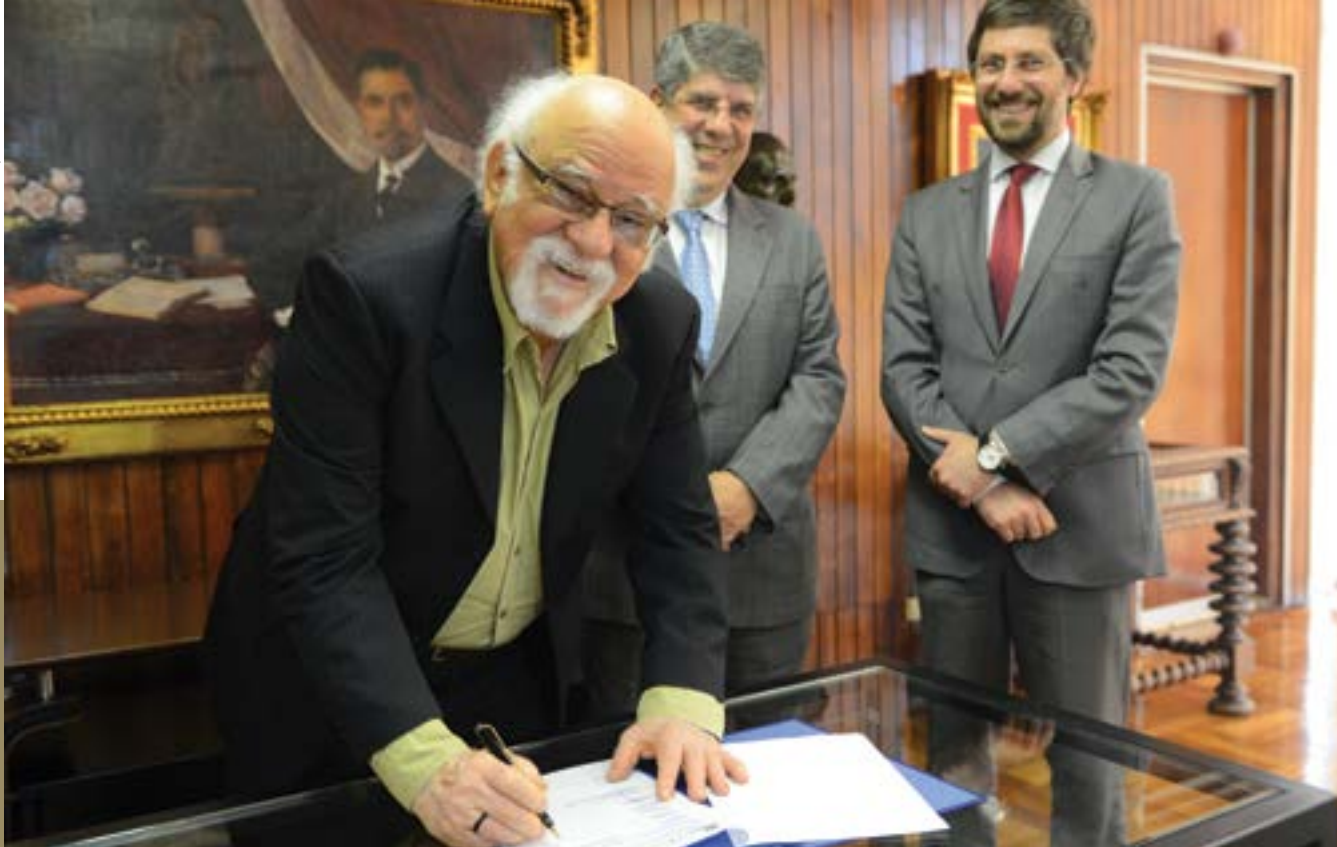
Assinatura do termo de cooperação com o Sesc São Paulo (Serviço Social do Comércio)

campanhas e no cotidiano da atividade política e contou com a participação de especialistas brasileiros e estadunidenses em matéria de financiamento de campanha eleitoral.