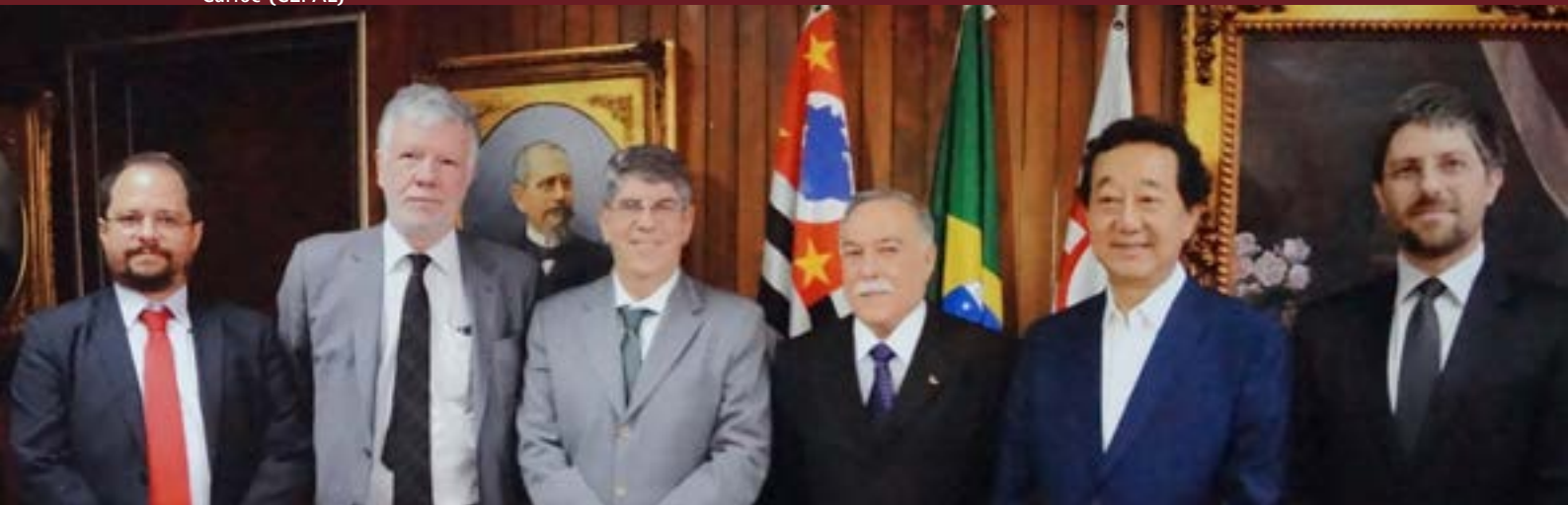
Assinatura do termo de cooperação com a Comissão Econômica das Nações Unidas para a América Latina e Caribe (CEPAL)