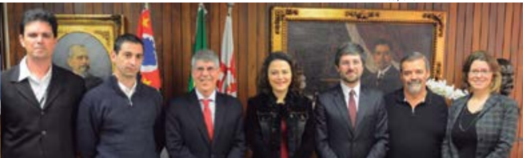
Acordo de cooperação firmado com a Universidade Federal de São Paulo (UNIFESP)