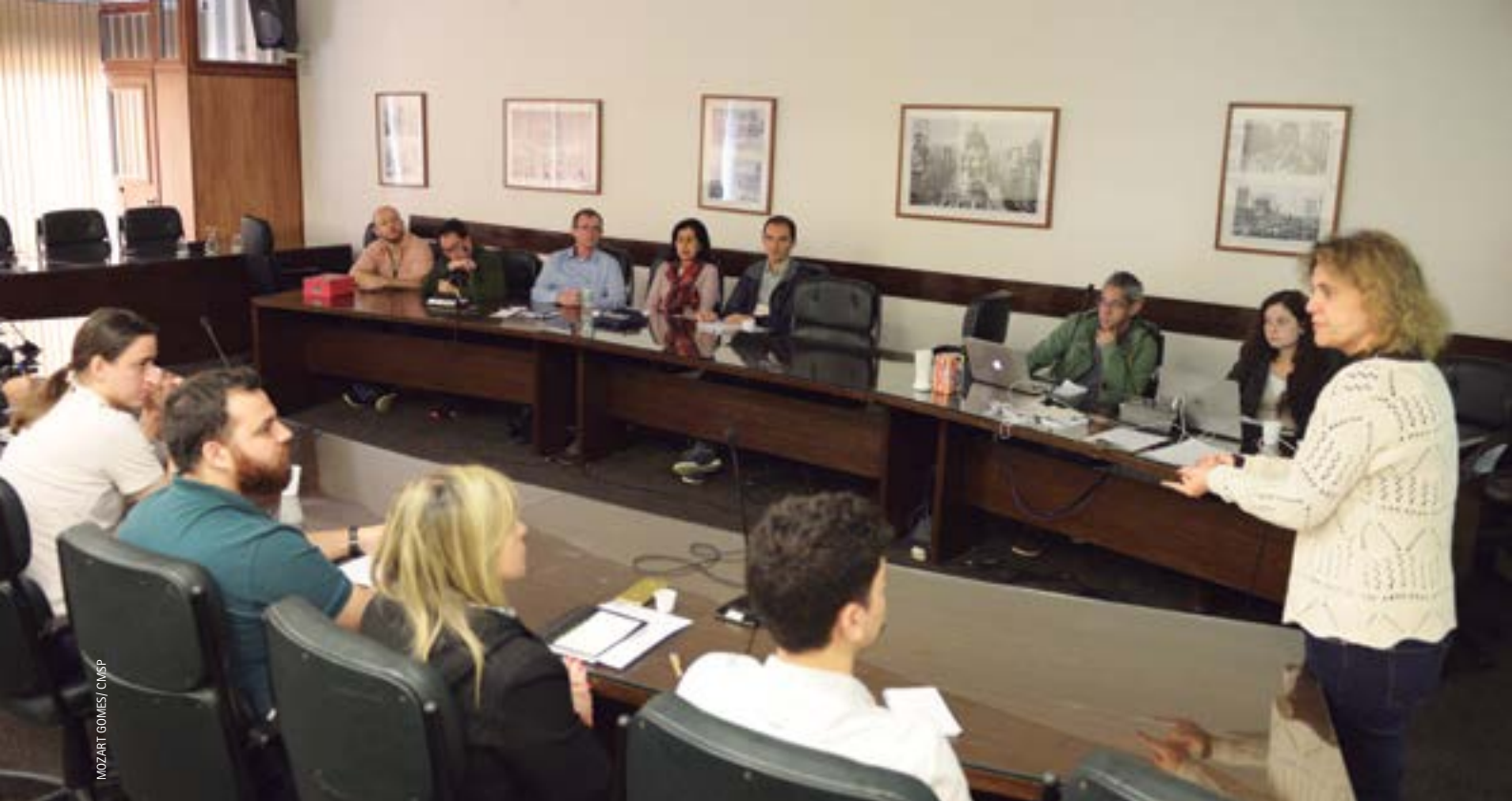
Curso Gestão de Equipes: desenvolvimento de competências conversacionais

36 Por sua vez, o curso Gestão e Qualidade das Políticas Educacionais no Brasil (2016) ofereceu aos participantes um conjunto de subsídios para a análise dos principais compromissos governamentais estabelecidos no Plano Nacional de Educação (Lei nº 13.005/2014), e para uma compreensão sobre as relações entre as metas do Plano, os programas e as políticas públicas propostas e implementadas pelos governos subnacionais, bem como debater de forma qualificada os desafios e as perspectivas para o cumprimento das metas estabelecidas.