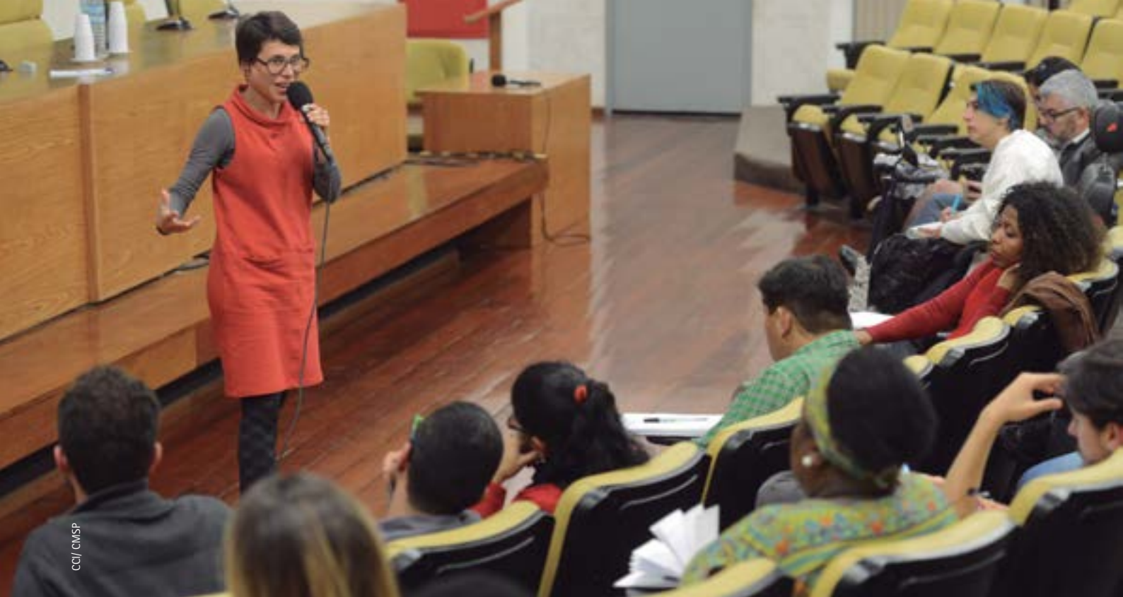
Curso sobre a Política Nacional para a Inclusão Social da População em Situação de Rua