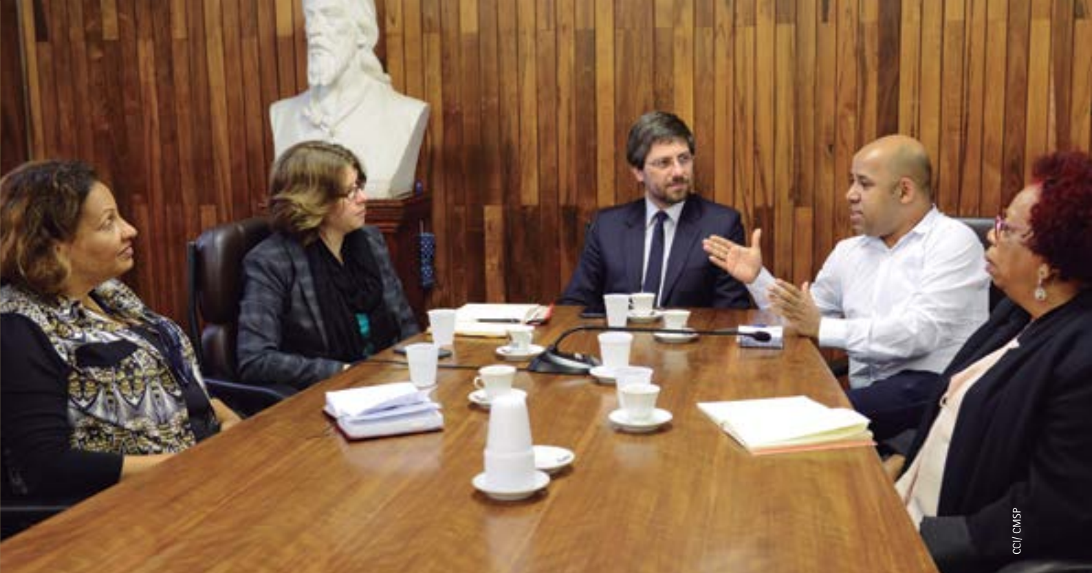
Reunião de preparação do curso Políticas de Promoção da Igualdade Racial e a Década Internacional de Afrodescendentes