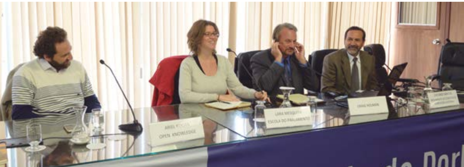
Ciclo de debates Abrindo a Câmara

– parceria da Escola com a Open Knowledge Brasil