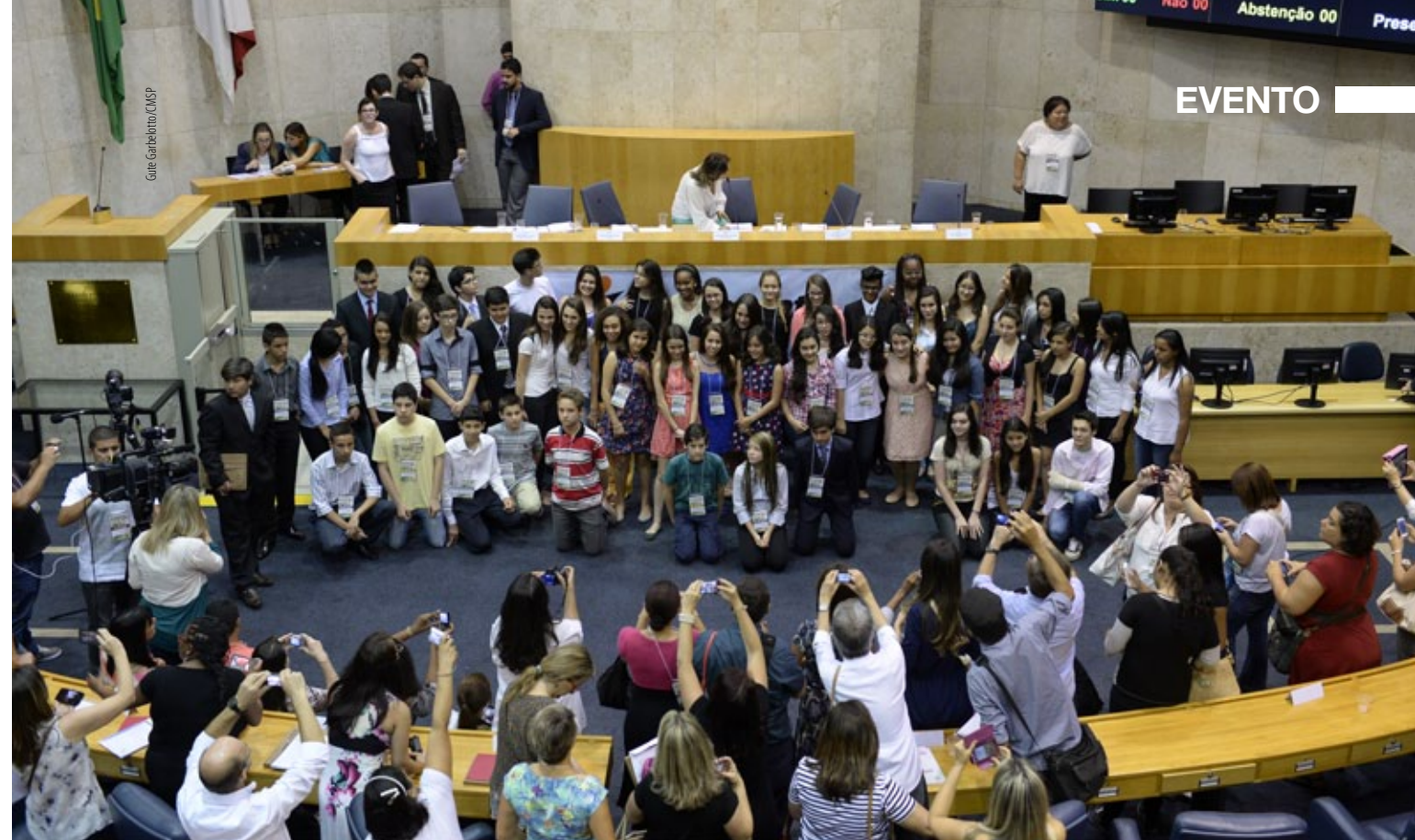
AULA • Vereadores jovens de 2014 reunidos no Plenário da Câmara